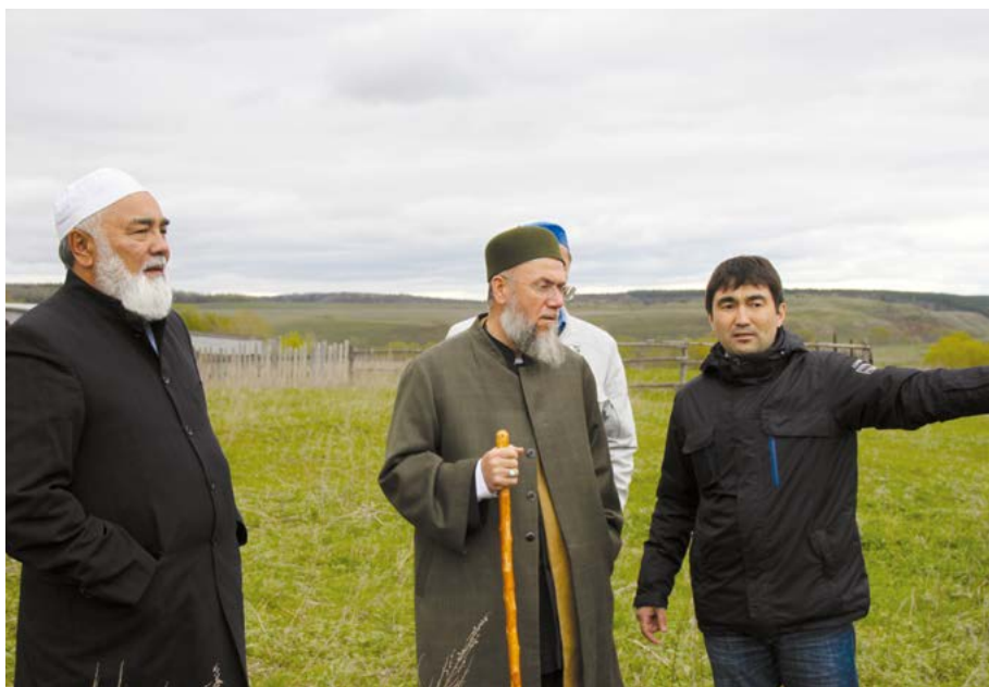
Шэйех Мэхмэт Өдил قدس سره