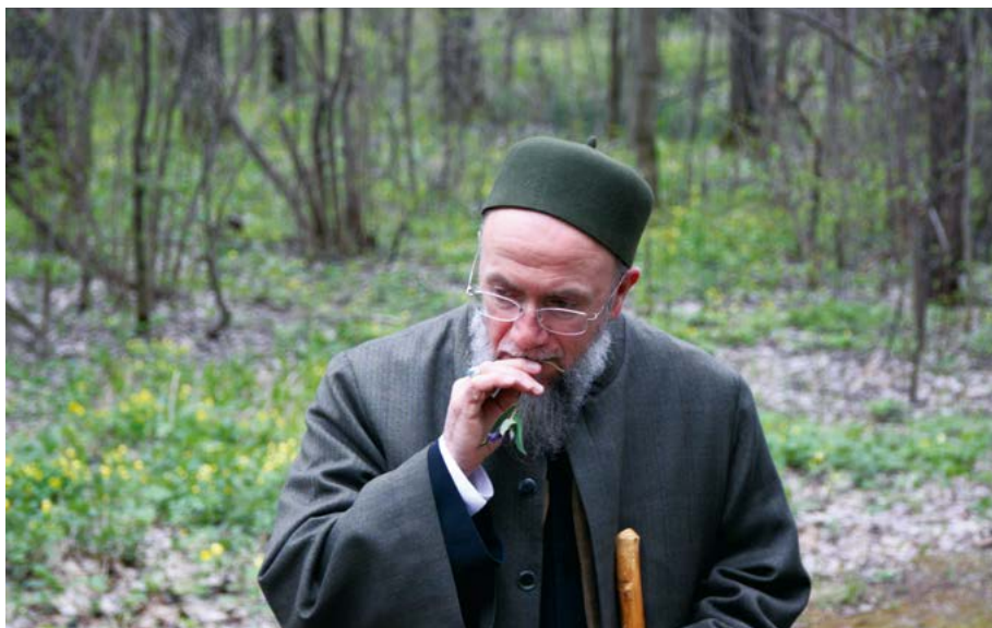
Шэйех Мэхмэт Өдил قدس سره