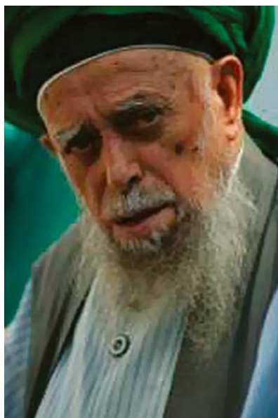
Шәйех Нәзим әл-Хаккани قدس سره

Фани донъя тиз ағышлы һәм вакытлыса ғына, иртәме-һуңмы барыбыз за Аллаһу Тәғәләгә кайтабыз. Шәйех Нәзимдә قدس سره был донъяла ук Аллаһу Тәғәләнен ләззәтле хозурында булыу теләге уяна. Ошонан башлап ул үз ғүмерен тулыһынса Аллаһу Сүбхәәнә үә Тәғәләгә хезмәт итеүгә бағышлай. Ул бе-