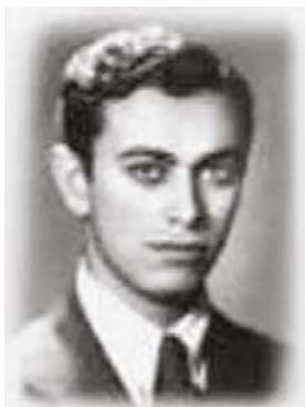
Шәйех Нәзим әл-Хаккани

тоғролоғо өсөн Аллаһ илсеһе ﷺ “Әс-Сиддык” (һүзмә-һүз тәржемәһе “Ысын хак”) тип йөрөткән. Был исемдәгеләр – пәйғәмбәрҙән һуң иң юғары дәрәжәгә ирешеүселәр. Накшбәндиә тәриҡәте – ошондай оло дәрәжәләргә ирештереүсе юл.