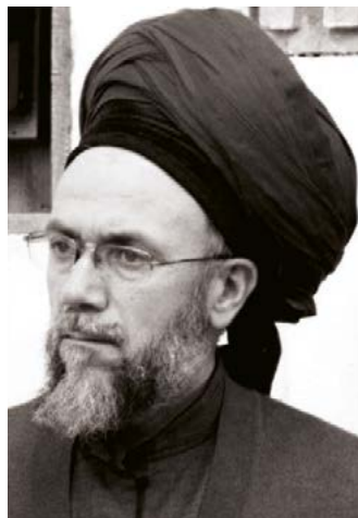
Шәйех Мәхмәт Әдил ән - Нақшбәнди قدس سره