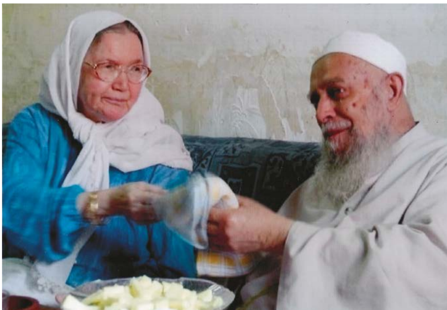
Солтан әүлиә катыны Хүәджә Әминә инәй менән (сығышы буйынса Минзәлә башкорто)