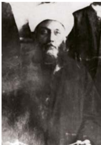
Шәйех Шәрәфетдин әл-Дағстани قدس سره