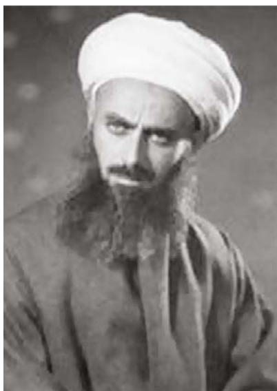
Шәйех Нәзим әл-Хаккани قدس سره

Мәүләнә шәйех Нәзимдә قدس سره өс ағаһы була, улар за Истамбул университетында белем ала. Шәйех Нәзимдә قدس سره иң яратқан кесе ағаһы медицина факультетында укый. II Бәтә