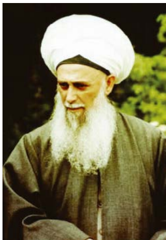
Шәйех Мөхәммәт Нәзим әл-Хәккани قدس سره